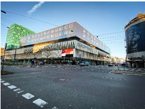
Zurheide, Außenansicht, Berliner Allee, Düsseldorf