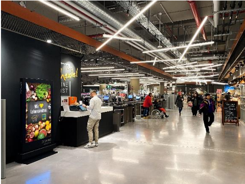
Indoor-DCLP, Zurheide, Standort Berliner Allee, Düsseldorf, Foto: DIGOOH Media