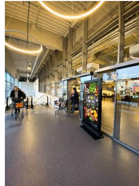
Indoor-DCLP, Zurheide, Standort Leipziger Straße, Düsseldorf