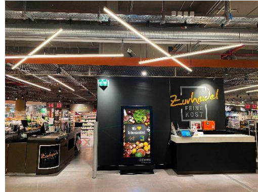
Indoor-DCLP, Zurheide, Standort Berliner Allee, Düsseldorf